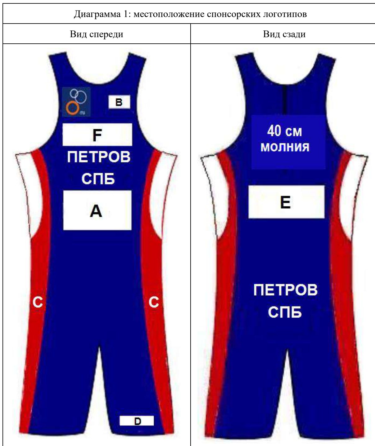
Диаграмма 1: Местоположение мест для спонсора

25.4.1. Стартовая форма должны иметь цвета, выбранные региональной спортивной федерацией для всероссийских соревнований по триатлону.